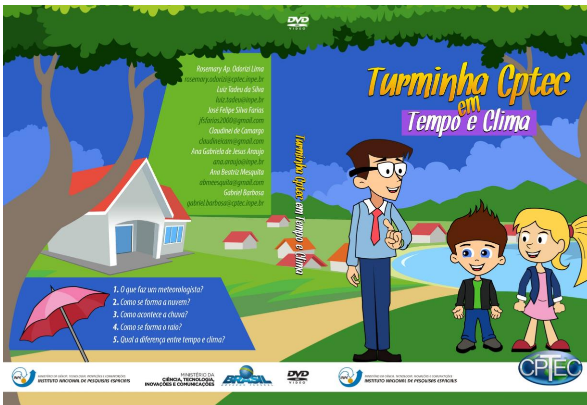
Figura 2: Capa do DVD Infantil sobre Tempo e Clima

Após a conclusão do material, o vídeo contendo todas as explicações, foi publicado no dia 31 de Outubro de 2016 no YouTube e Facebook. Desde então o vídeo atingiu 329 visualizações no YouTube e teve um alcance de 313 pessoas no Facebook até o dia 5 de julho de 2017. O vídeo ainda foi publicado na página do CPTec, porém a página não exibe o número de visualizações dos vídeos.