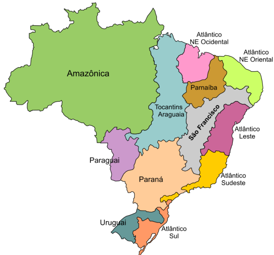
Figura 1 - Bacias Hidrográficas do Brasil