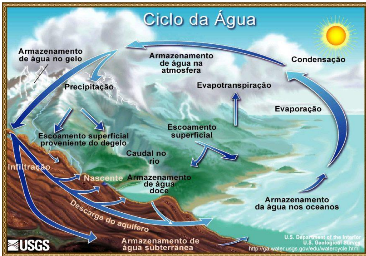
Figura 3 - Ciclo da água.