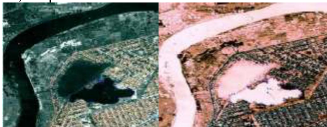
Figura 4. Região do rio Poti e lago Mocambinho sem e com filtro multiespectral, respectivamente.

4 apresentam imagens obtidas pelos satélites com e sem a varredura multiespectral. A segunda imagem apresenta um contraste negativo por análise multiespectral para visualização do material em suspensão, água e esgoto.