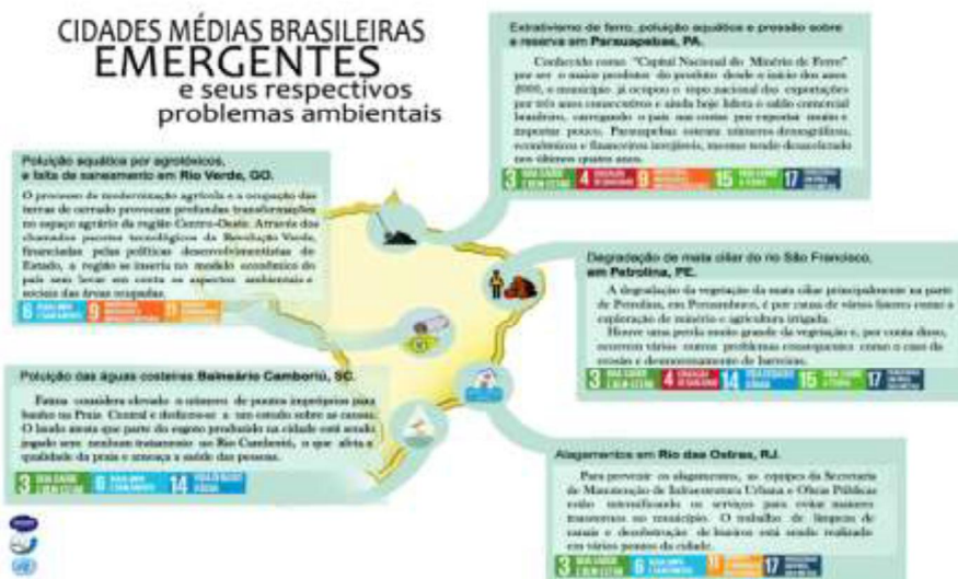
Figura 1. Cidades médias brasileiras escolhidas e seus respectivos problemas ambientais.

O infográfico desenvolvido está ilustrado na Figura 1, indicando os problemas ambientais estudados nas cidades escolhidas para o presente trabalho. O infográfico inclui, ainda, os Objetivos de Desenvolvimento Sustentável da ONU abordados pelos métodos de solução propostos para cada um dos cinco estudos de caso realizados.