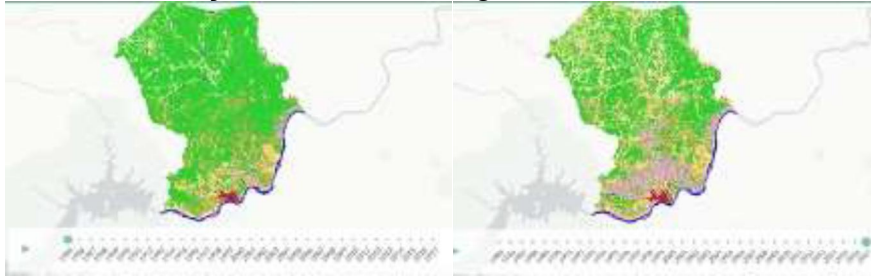
Figura 2. Mapa de Petrolina (PE) em 1985 e 2017. A cor verde indica a formação savânica na região.