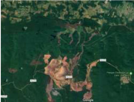
Figura 3. Crescimento da exploração na Serra dos Carajás na Área de Proteção Ambiental do Igarapé Gelado.