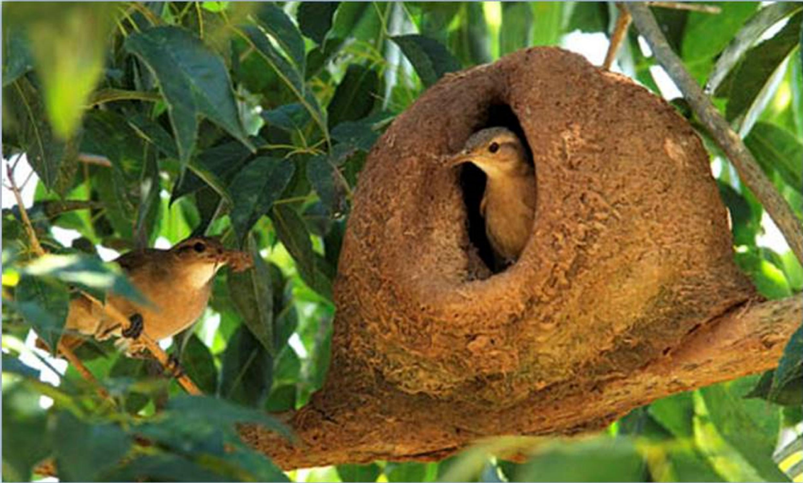
João de Barro