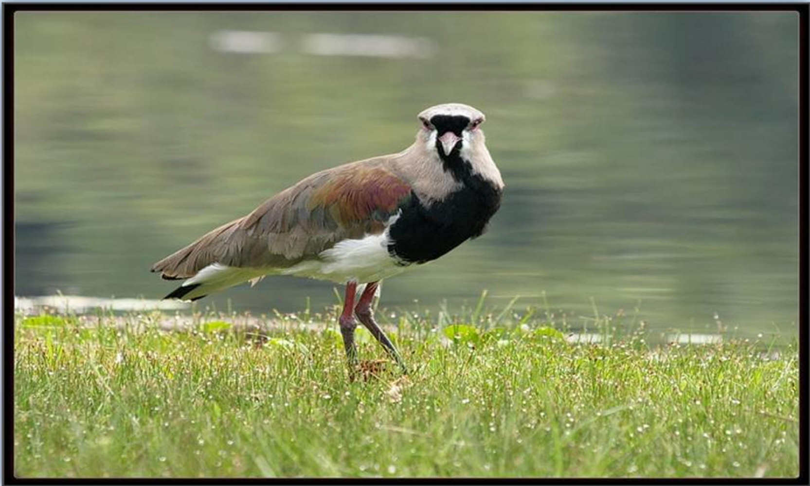
Quero - Quero