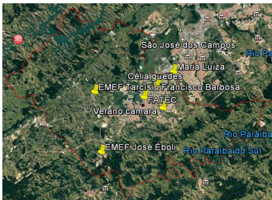
Figura 2 – Localização das escolas participantes do município de Jacareí.

Os registros obtidos nas escolas foram usados para realizar a média de precipitação do município.