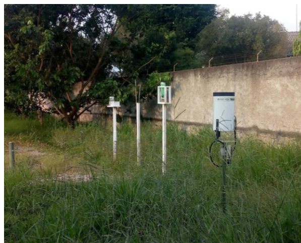
Figura 1 – Foto do pluviômetro artesanal no centro e pluviômetro de básculas semiautomático padrão CEMADEN à direita. Do autor (2019).

A localização dos pluviômetros utilizados pode ser contemplada na figura 1.