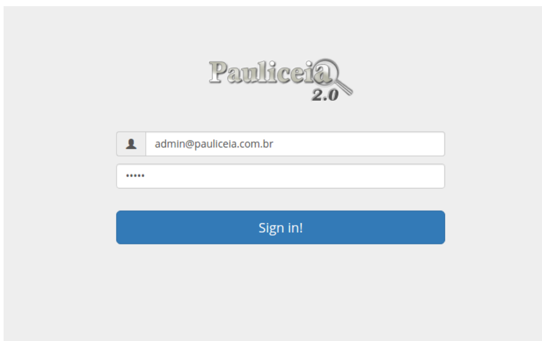
Tela de login do portal web GIS – figura 2

Abaixo, tem-se a visualização da tela de login e edição de conteúdo no mapa, respectivamente.