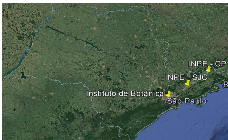
Figura 1 Imagem do Google earth com a localização dos sítios de amostragem