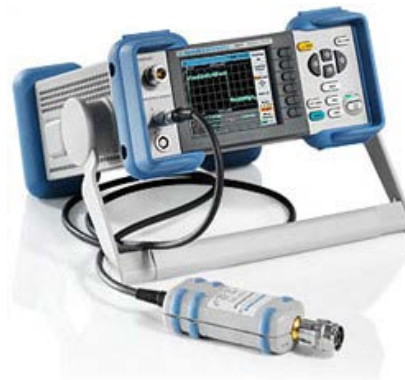
Figura 9 – Power Metter e Power Sensor Rohde-Schwarz NRP2

Este tipo de equipamento tem como função, verificar com grande certeza, a amplitude de sinal gerada por um determinado equipamento (por exemplo, um gerador de frequência, ou pelo próprio satélite testado). Com este equipamento, podemos ter medida com alto nível de precisão, desta maneira, este tipo de equipamento tem a necessidade de verificações periódicas detalhadas na sua leitura de amplitude em diversas frequências diferentes. Por se tratar de um equipamento muito sensível, seu manuseio deve ser realizado com extrema cautela.