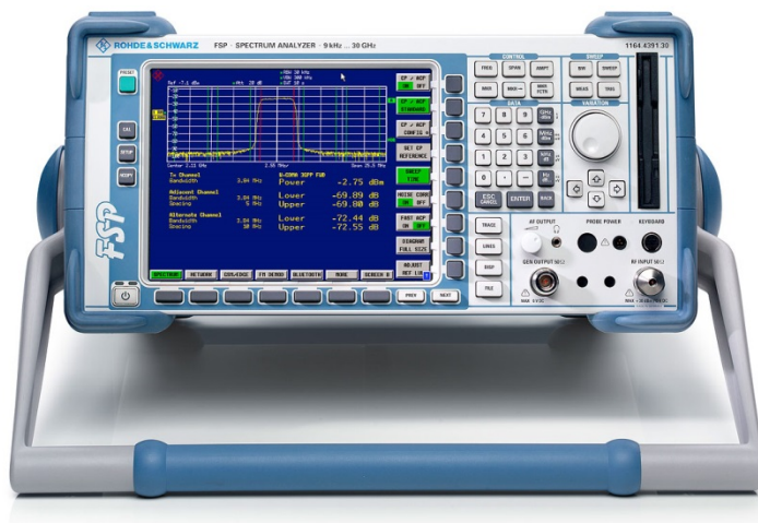
Figura 4 – Spectrum Analyzer Rohde-Schwarz

Desta maneira, os analisadores de espectro, devem periodicamente sofrer verificações de diversas maneiras, para garantir seu bom estado de conservação e utilização, tendo em mente a qualidade da medida realizada. Segue exemplo de verificação nas figuras 5 e 6: