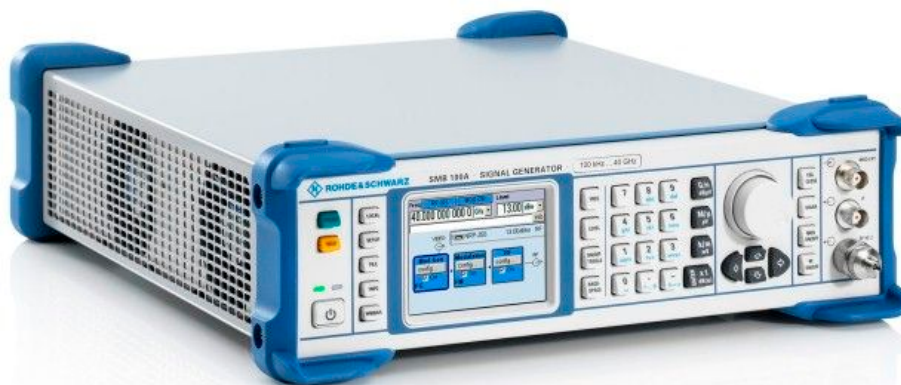
Figura 7 – Gerador de Sinal Rohde-Schwarz SMB100 A