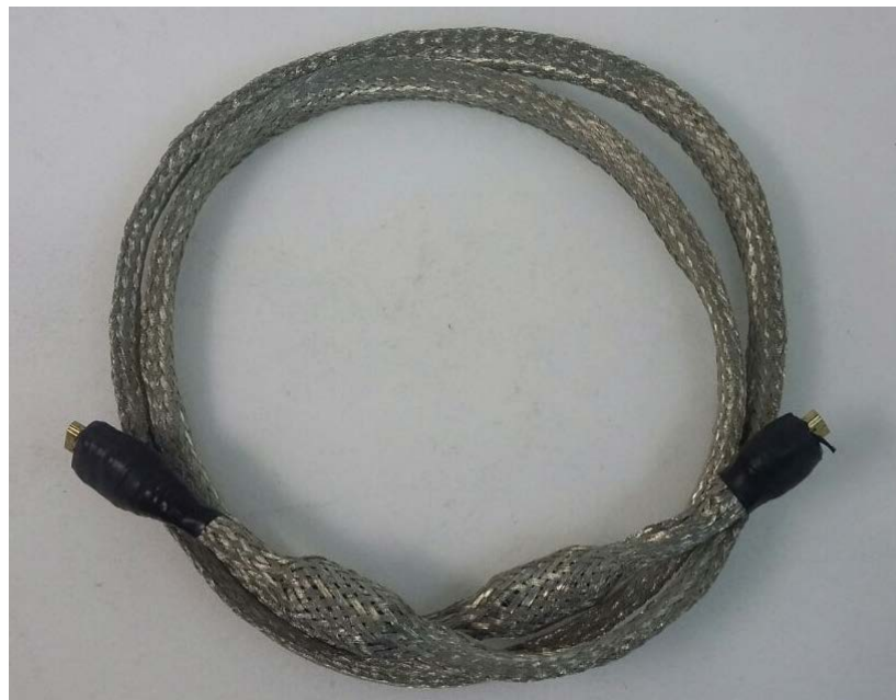
Figura 5 – Cabo HDMI Blindado

Blindagem de Cabos HDMI para Teste em Televisores: Os testes em televisores são feitos com todas as interfaces existentes no aparelho, configuradas. Para um destes ensaios é necessário que o televisor se comunique com um aparelho de DVD, ou receptor através de um cabo HDMI. Foi identificado que durante o teste este cabo emite ruídos indesejáveis, e para a solução deste problema, fazer a blindagem do cabo com malha de aterramento aterrará-lo com o conector satisfaz as necessidades de redução de ruídos.