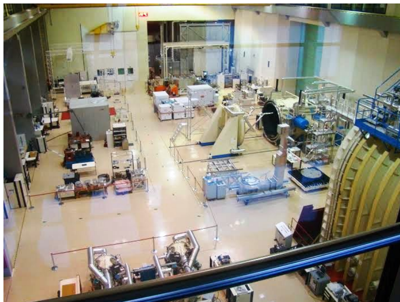
Figura 1 – Hall de Testes do LIT