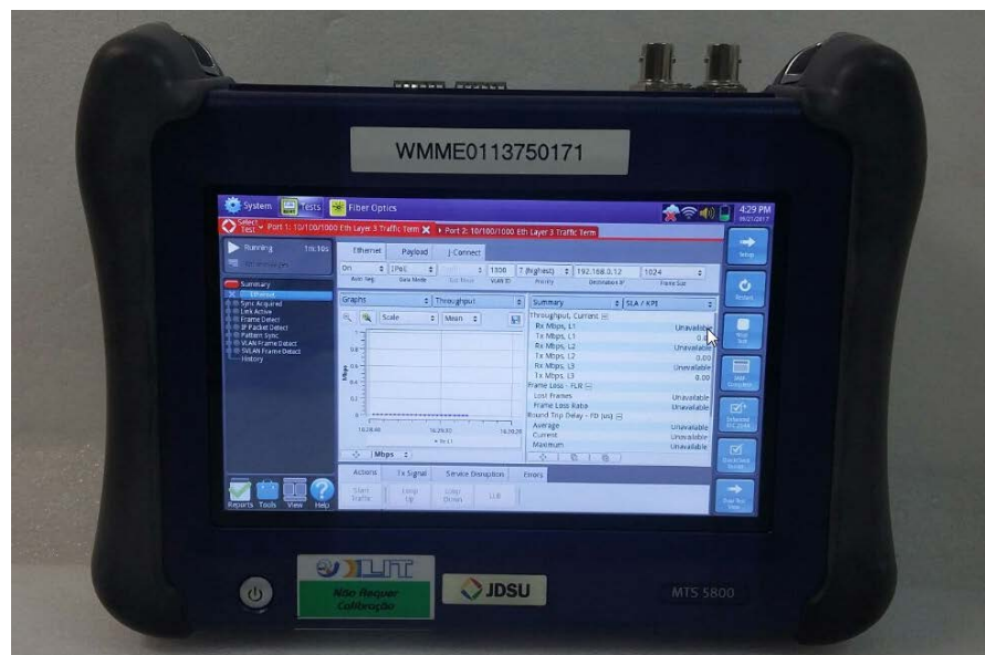
Figura 3 - Gerador de Tráfego, JDSU MTS 5800

A análise do desempenho deste tipo de equipamento durante os ensaios deve ser feita utilizando-se um Gerador de Tráfego de Dados. Estes aparelhos tem a capacidade de medir quantos pacotes foram enviados e recebidos durante um período. Configurar tráfegos de dados entre as portas do equipamento sob teste, garante que a análise e a classificação do equipamento sejam feitas.