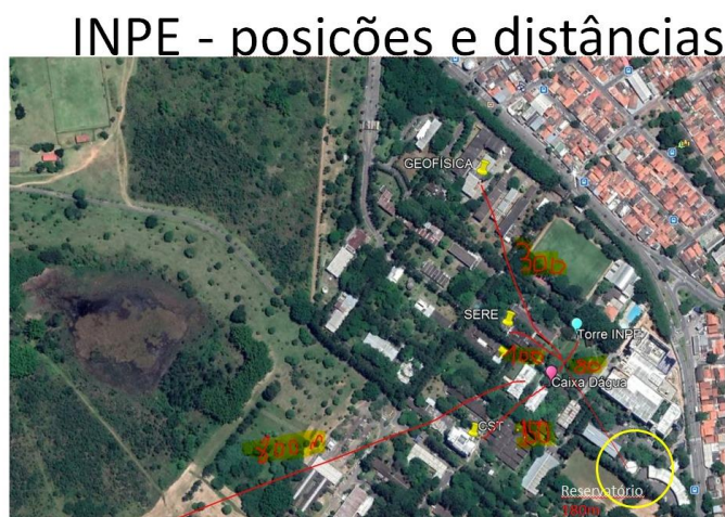
Figura 3 – Pontos aproximados de observação dentro do INPE

Porém, devido a burocracia e demora no que se diz respeito à parte administrativa do projeto referente as instituições citadas, o projeto foi desmontado e será desenvolvido a princípio dentro do INPE, o que dá rapidez e fluidez no que se trata de instalação de equipamentos e locomoção até o local de observação.