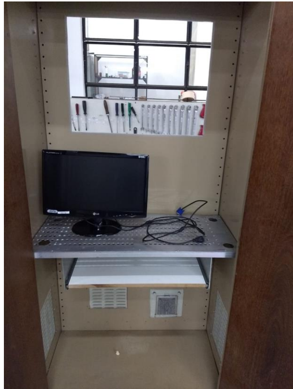
Figura 2 – Armário que guarda os equipamentos, com corte na parte de trás para termos a visão do edifício.