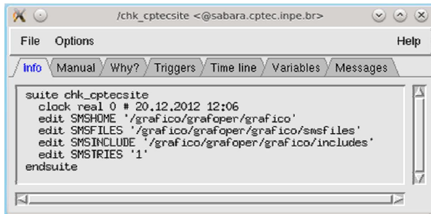
Figura 3 - Configurações de uma suite do SMS.

# Definition of the suite test. setenv -i HOME suite test edit SMSINCLUDE "$HOME/course" edit SMSHOME "$HOME/course" family f1 task t1 task t2 endfamily endsuite